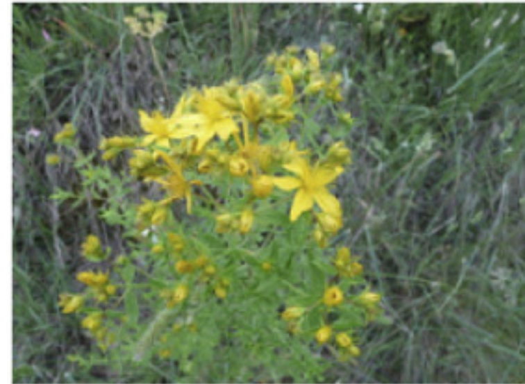
L'herba de Sant Joan o pericó, usada per a fer oli de cop

El treball de camp que estem duent a terme segueix la metodologia etnobotànica, és a dir fem entrevistes a persones del territori amb coneixements sobre el tema, ja sigui perquè encara utilitzen alguns d'aquests remeis o perquè els seus familiars els ho havien explicat. Fins ara hem parlat amb 30 persones (21 dones i 8 homes), totes elles nascudes al Lluçanès entre els anys 1914 i 1947 (la majoria hi continuen vivint en l'actualitat). Les entrevistes, amb enregistraments de veu, fotografies i a vegades algun video, es fan habitualment a casa de la persona informant. Les converses, d'una durada aproximada de dues hores cadascuna, són posteriorment transcrites, tot respectant el llenguatge i les expressions de l'informant. A més si el temps ho permet fem una petita sortida als voltants per observar i recol·lectar algunes de les plantes de què ens han parlat.