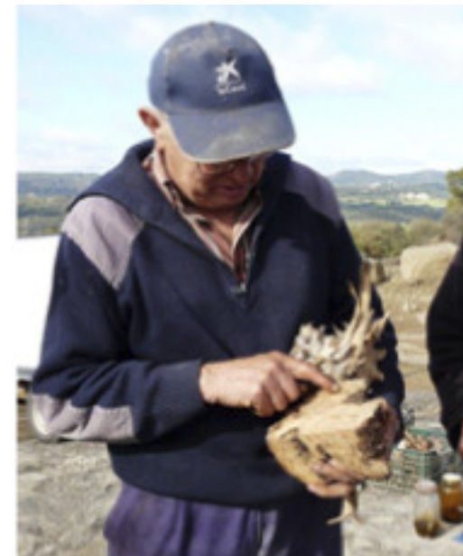
Timó, una de les plantes més utilitzades al Lluçanès. Un dels informants mostrant una soca de ginebre blanc.